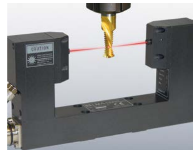
Бесконтактный контроль инструмента любой формы