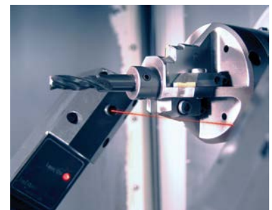
Быстрое выявление микроизноса на резце