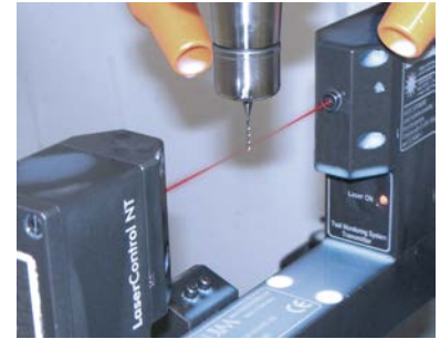
Компактные системы обеспечивают высочайшую точность