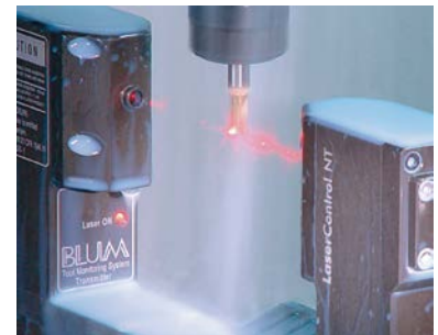
Надежность процесса – патентованная NT-электроника