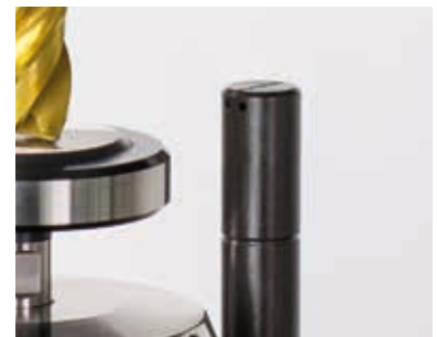
с опцией: Продувочное сопло