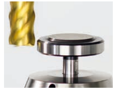
Измерение радиуса инструмента